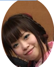
ユ プイサン 異文化コミュニケーション研究科 架け橋