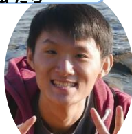
ゴ チュウリン 経済学部 「せっかく」だから