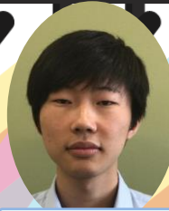
リントウ 文学部 人を变える力