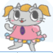
チョウ リサ ビジネスデザイン研究科 ねこじた猫舌