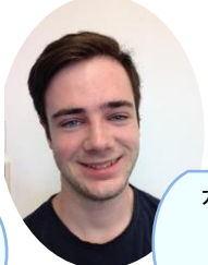
ガベット ヒース トマス 経営学部 オーストラリアと日本の関係