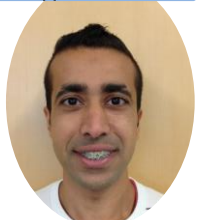
アル マムド フセイン アブデラ ジェイ 理学部 カルチャーショック