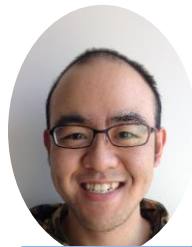
カン ゴウ 文学部 変わった自分