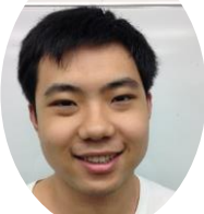
サイ シュンキン 文学部 変革の時代を生きている私たち