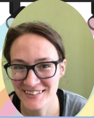
ミリング タミー キット 経営学研究科 お客様のおかげ