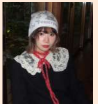
異文化コミュニケーション学部

キャリアの日本語Aは、就職活動やキャリア形成に必要な日本語スキルを向上させるための授業です。ビジネスメールや敬語表現、自己紹介や面接対応など、実践的な内容を学びます。授業では、日本語力だけでなく、社会で役立つコミュニケーション能力も身につけることができます。日本企業での就職を目指している方や、ビジネス日本語に興味がある方におすすめの授業です。