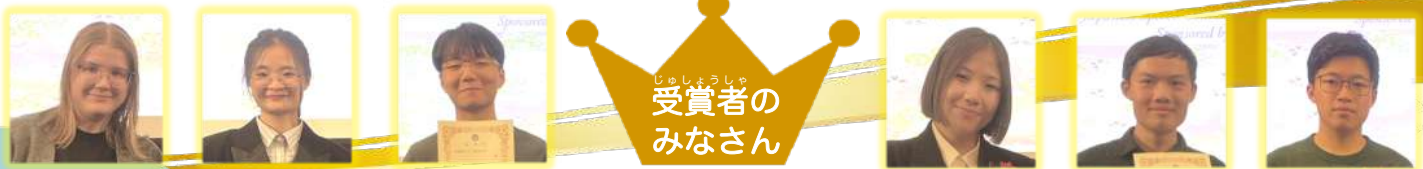
受賞者の みなさん

日本語教育センターの方々をはじめとする関係者の皆様のご協力で、第13回日本語スピーチコンテストが開催できたことを感謝申し上げます。終始和やかな雰囲気の中で行われ、出場者の皆さんが堂々とスピーチを発表していたことが印象的です。日本語の発音に気をつけながらアドバイザーと一緒にたくさん練習してきたことが伝わりました。